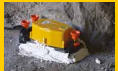
▲ Le capteur sismique, prêt à fonctionner

Oui, nous avons posé un capteur le soir même chez elle et avons attendu la phase de tir suivante. Le seuil de vibration n'a pas été dépassé. Même si ce n'est pas toujours simple, il faut bien distinguer les vibrations mécaniques transmises par le sol et l'onde aérienne causée par l'explosion elle-même. En se propageant, cette onde peut provoquer des vibrations qui relèvent alors du ressenti de chacun et sans aucun risque de désordre pour les habitations.