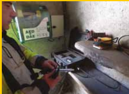
▲ Installation des capteurs sismiques

Les équipes viennent poser des cintres, sortes de rails arrondis, tout autour de la paroi. Ces cintres ont un rôle de protection et de sécurité pour les équipes travaillant sous terre (chutes de petits blocs), de soutien pour assurer la stabilité des gros blocs et de confinement pour limiter les mouvements du terrain. Le tout est soutenu par du béton projeté sur les parois.