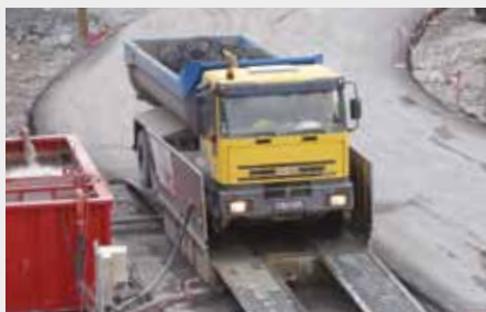
Le déboureur en action ▲▶

L'objectif : que les abords du chantier restent propres pour les automobilistes et les riverains.