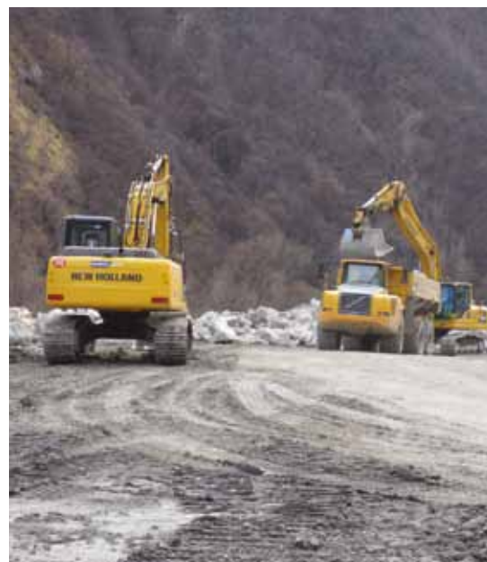
▲ La réalisation des enrochements d'un des sites de dépôts a été confiée à des entreprises locales

Sur le chantier des ouvrages de reconnaissance de Saint-Martin-La-Porte, la mobilisation du tissu économique local et de la main d'œuvre disponible est une priorité . Un protocole d'accord pour l'emploi et l'insertion vient d'être approuvé. Plusieurs acteurs locaux sont ainsi pleinement mobilisés comme Maurienne Expansion et l'agence Pôle emploi de Saint-Jean-de-Maurienne. Plusieurs entreprises de Maurienne travaillent d'ores et déjà en sous-traitance pour ce chantier et des embauches locales sont réalisées.