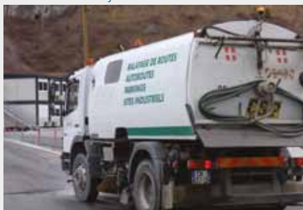
▼ Le camion balayeuse